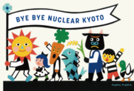
tupera tuperaさんが描いてくれたイラスト